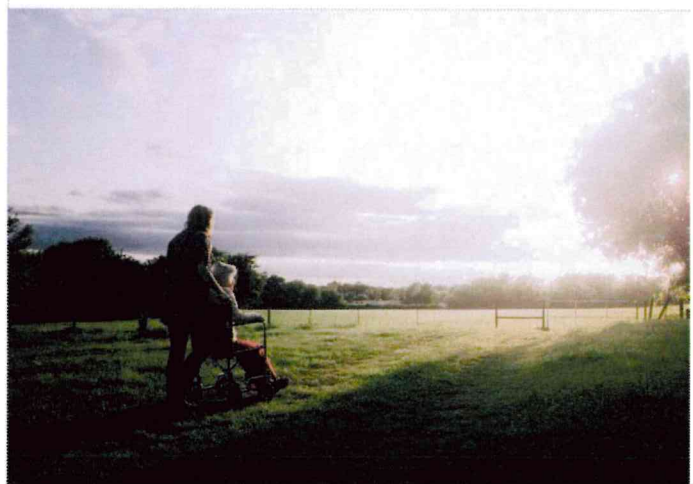
Foto: signaalbericht over werk en mantelzorg

HEEL BELANGRIJK...EIGEN DINGEN BLIJVEN DOEN, VRIENDEN SPREKEN EN VOLDOENDE RUST NEMEN.