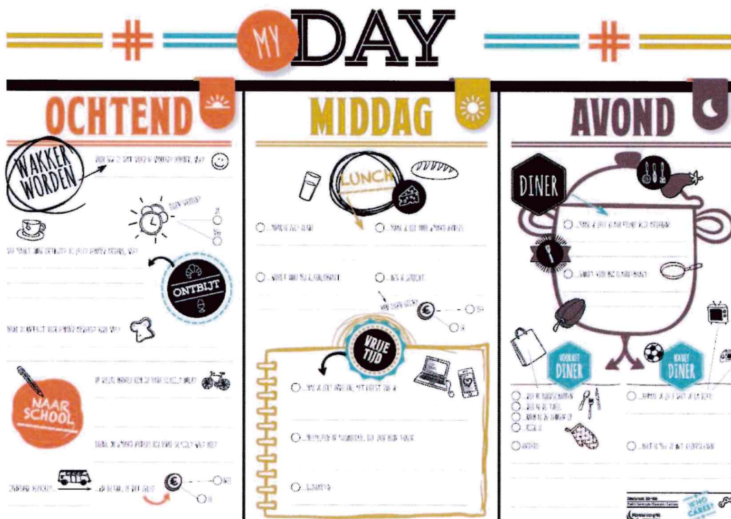
Foto: placemat uit de toolkit Jonge mantelzorgers

Onderdeel van de toolkit, de voorstelling 'What if' werd in diverse klassen en groepen vertoond. Hierbij werd intensief samengewerkt met de jeugdwerkers van Rijnstad.