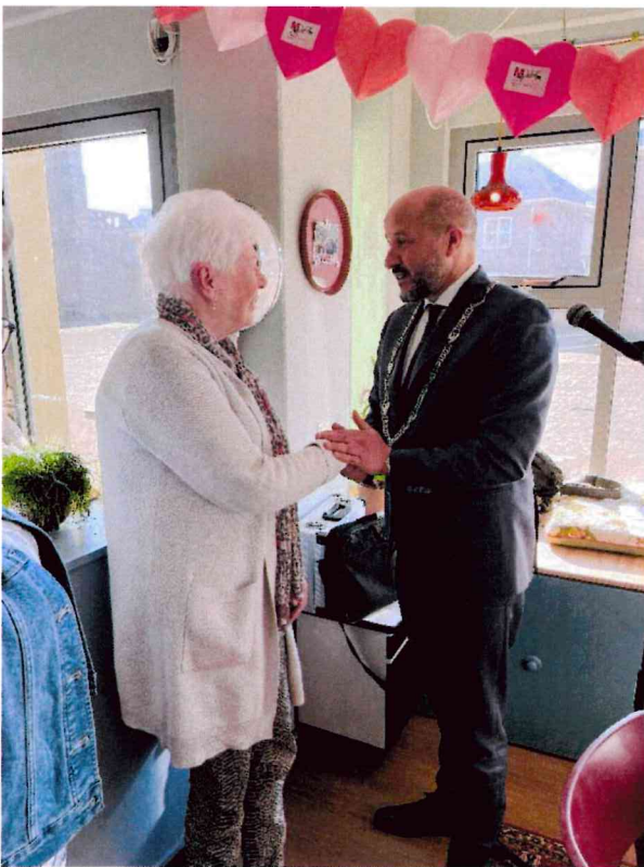
Foto: uitreiking lintje