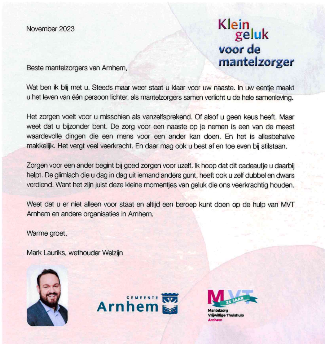
Foto: bericht van de wethouder voor mantelzorgers

Bij het kadootje voor de mantelzorgers zat ook een persoonlijke boodschap van de wethouder aan de mantelzorgers: