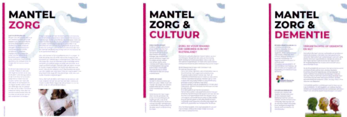
Foto: thema bewaar-edities

Dit jaar hebben we ook een grote stap gemaakt in onze informatievoorziening op thema. Maar liefst 9 onderwerpen hebben een eigen bewaar-editie gekregen. Elk een brochure vol met (blijvend actuele) informatie die niet alleen op onze website te lezen of aan te vragen zijn, maar ook beschikbaar zijn voor professionals om uit te delen.